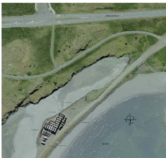
Núverandi gámabyggð á loftmynd