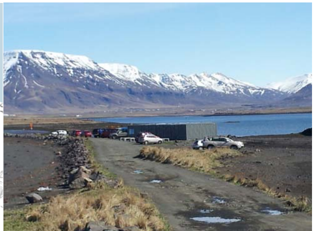
Ljósmynd tekin 9.5.2013

Aðstaðan samanstendur af 13 gámaeingum, fjórum 20 feta einangruðum aðstöðu gámum, kaffigám, sturtu-, og búnaðargám, kvennaklefa, og karlarlaklefa, sjö 20 feta kayakgeymslugámum, og tveggja 40 feta kayakgeymslumgámum. kayakgeymslugámarnir reiknast til að hýsa a.m.k. 9x20 sjökayakbáta eða alls 180 sjökayakbáta. Auk þessa eru félagsbátar í helming annars 40 feta gámsins og sit on top bátar í helming hins 40 feta gámsins og eru þeir settir eru í hliðarpláss sitt hvoru megin með gönguleið á milli. Einum 20 feta gám var bætt við í janúar 2014 og leysti það geymsluvandann