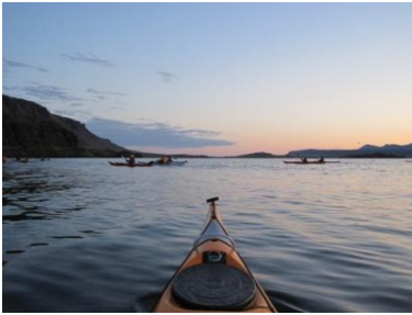
Mynd 6 GIG

Þann 23. júní 2011 kl. 22:00 héldu 24 ræðarar í næturróður eftir dýrindis pylsuveislu sem Ólafía skellti upp í fjörunni í Hvammsvík.