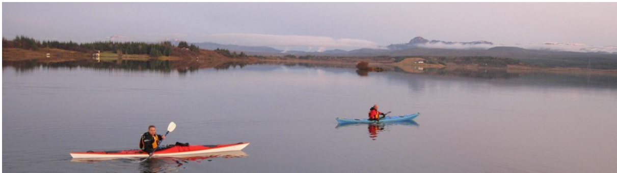
Mynd 16 GIG

Fimmtudag 27. október var róið á Elliðavatni. Þessi róður tilheyrði vetradagskrá þar sem ætlunin var að fara stutta róðra í nágrenni við höfuðborgina.