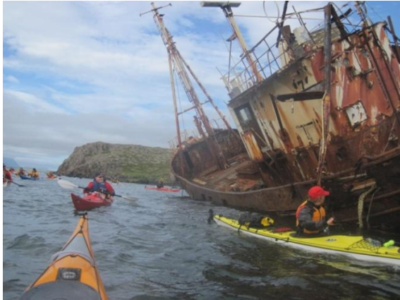
Mynd 11 GIG