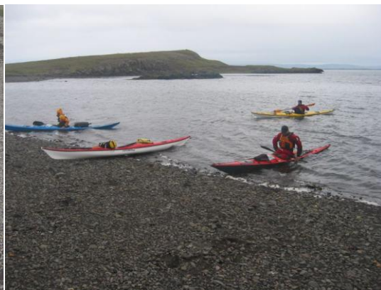
Mynd 9 PR

25. júlí: Vöknuðum í vestan andvara og þurru veðri. Eftir snæðing tókum við saman föggur okkar og nú tók við lengsta róðrarleiðin, um 25 km, yfir að Setbergi í Grundarfirði. Heldum frá landi um kl. 11 f.h. og rérum út fjörðinn sem leið liggur að brúnni. Háflóð átti samkvæmt okkar kokkabókum að vera um kl. 14:30, og mátti því búast við einhverjum mótstraumi og iðum við brúna, en við treystum á að þar sem var smástreymt þessa daga yrði það okkur ekki til trafala. Ekki reyndist þetta mikil hindrun.