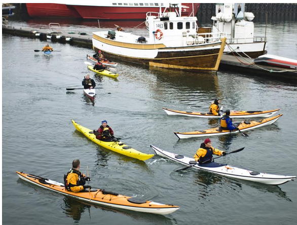
Mynd 5 ESM

Brottför var frá bílasæðinu við Skarfaklett, róíð með landi fyrir Laugarnes, um Rauðarárvík að Sólfarinu, inn í Reykjavíkurhöfn, þar sem dáðst var að tónlistarhúsinu Hörpu, róíð áfram um höfnina að lendingunni við Sjóminjasafnið og svo með landi aftur til baka.