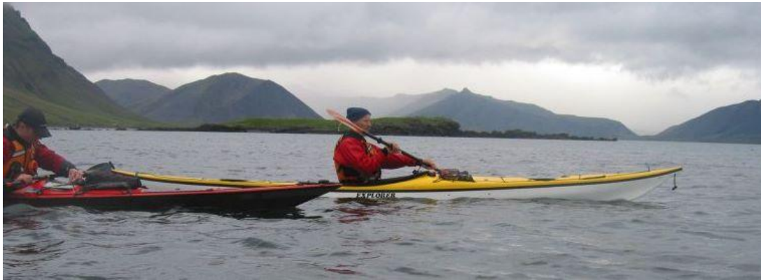
Mynd 10 PR