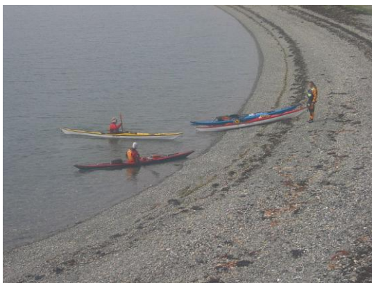
Mynd 8 PR