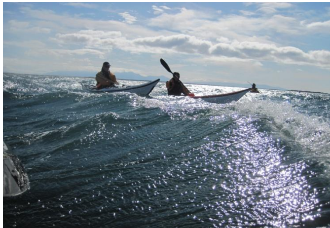
Mynd 14 GIG

Húseyjan í Hvalseyjum er sendin með hvítum skeljasandi og svörtum klöppum og vaxin melgresi nema að sunnan þar sem er mittisdjúp baldursbrá og hvönn, en þar eru lundaholur og æðarhreiður og er allt nokkuð erfitt yfirferðar. Fjöldi skerja er í grenndinni og er þar mikið af skarfi.