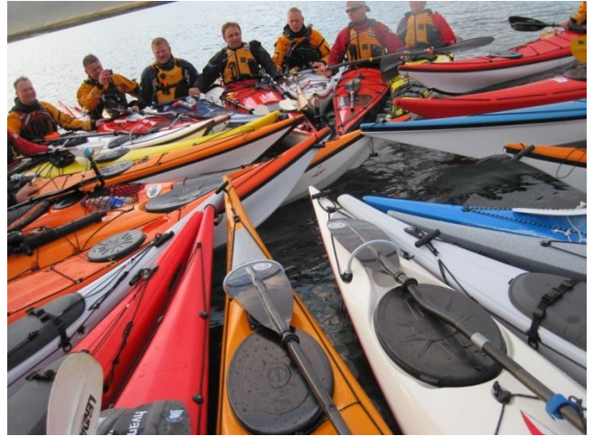
Mynd 2 GIG

Fjölgun ræðara í sumar var nokkuð áberandi. Allt að tvöfjórðing fleirri mættu í félagsróðra en árið áður og skilaði það sér í þáttöku í léttari ferðum sumarsins, Þingvallavatni, Jónsmessuróðri, Hörpuróðri, Breiðafirði og Kleifarvatni. Og sem betur fer fjölgar líka reynsluboltum og BCU „stjörnum“ í sama hlutfalli. Góð róðarstjórn og öryggi ferða er undir þessum reynsluboltum komið.