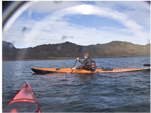
Mynd 15 ESM

Róið var réttsælis hringur og ströndinni nokkuð vel fylgt í rjóma blíðu, nema hvað Lambhaga var sleppt. Heildarróðrarlengd var 11,4 km.