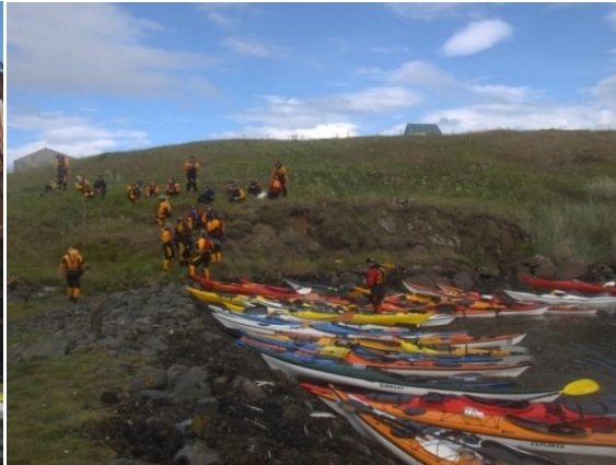
Mynd 12 ESM

Menn hittust á föstudagskvöldi nálægt bænum Ósi á utanverðri Skógarströnd, þar sem slegið var upp tjöldum á sléttri grund við Setbergsá og þar með klúbbtjaldiru góða.