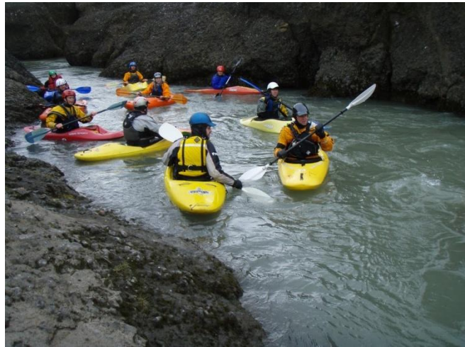
Mynd 4 SAS

Þetta er allt öðru vísi sport en sjókeyakin, hef sjálfur oft verið í miklu meiri látum, en ekki í svona miklum straum. Fannst þó mesti munurinn liggja í bátnum sjálfum og hvernig er setið í bátnum. Straumkayak er með minna flot, en sjókeyak, afturendinn styttri og er fljótur að kaffærast í "eddy lines", ef ræðari hallar sér eitthvað aftur. Lenti þrisvar í að "eddylines", straumskil kaffærðu mér og synti einu sinni. Held að allir sjómenn syntu eitthvað á leiðinni, mismikið samt. Vanar straumendur voru með í för og höfðu gaman af björgunum.